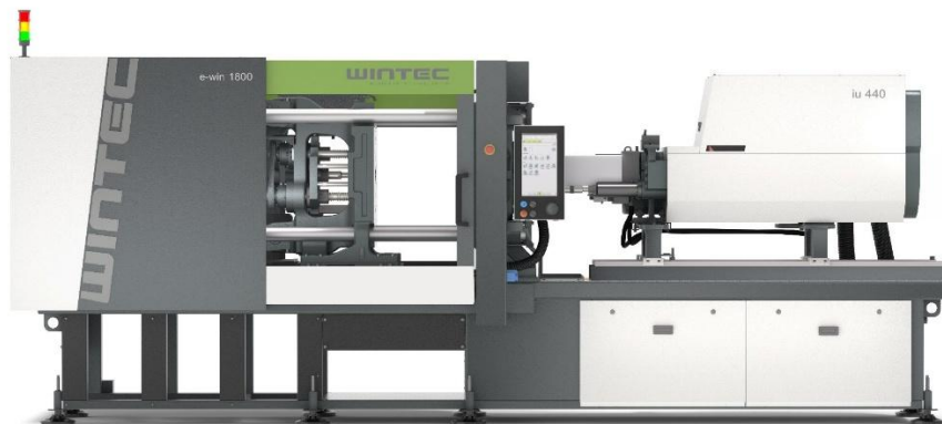
Bild 01: Die vollelektrische e-win 1800 kombiniert kompakte Bauweise mit hoher Wirtschaftlichkeit für effiziente Serienproduktion.